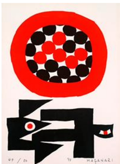
Masanari Murai, Sun and Bird , 1973 Kosai

Izložba predstavlja 42 hanga grafike deset umetnika koji su istraživali širok spektar mogućnosti kroz grafiku i širili dijapazon izraza u savremenoj umetnosti koristeći štampani medij 1970-ih. Umesto da se fokusira na stručnjake za koje se smatra da su oblikovali istoriju savremene japanske grafike, izložba se bavi otiscima slikara koji su se oslanjali na trendove u savremenoj umetnosti i pokušajima da se preispita postojeća istorija savremene japanske grafike. Umetnici čije radove ćemo videti su: Masanari Murai, Tošinobu Onosato, Jasukazu Tabući, Jajoi Kusama, Nacujuki Nakaniši, Hitoši Nakazato, Tomoharu Murakami, Naojoši Hikosaka, Kosai Hori i Toeko Tacuno.