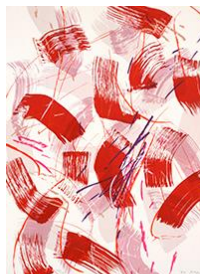
Hori, Hot Wind I , 1984